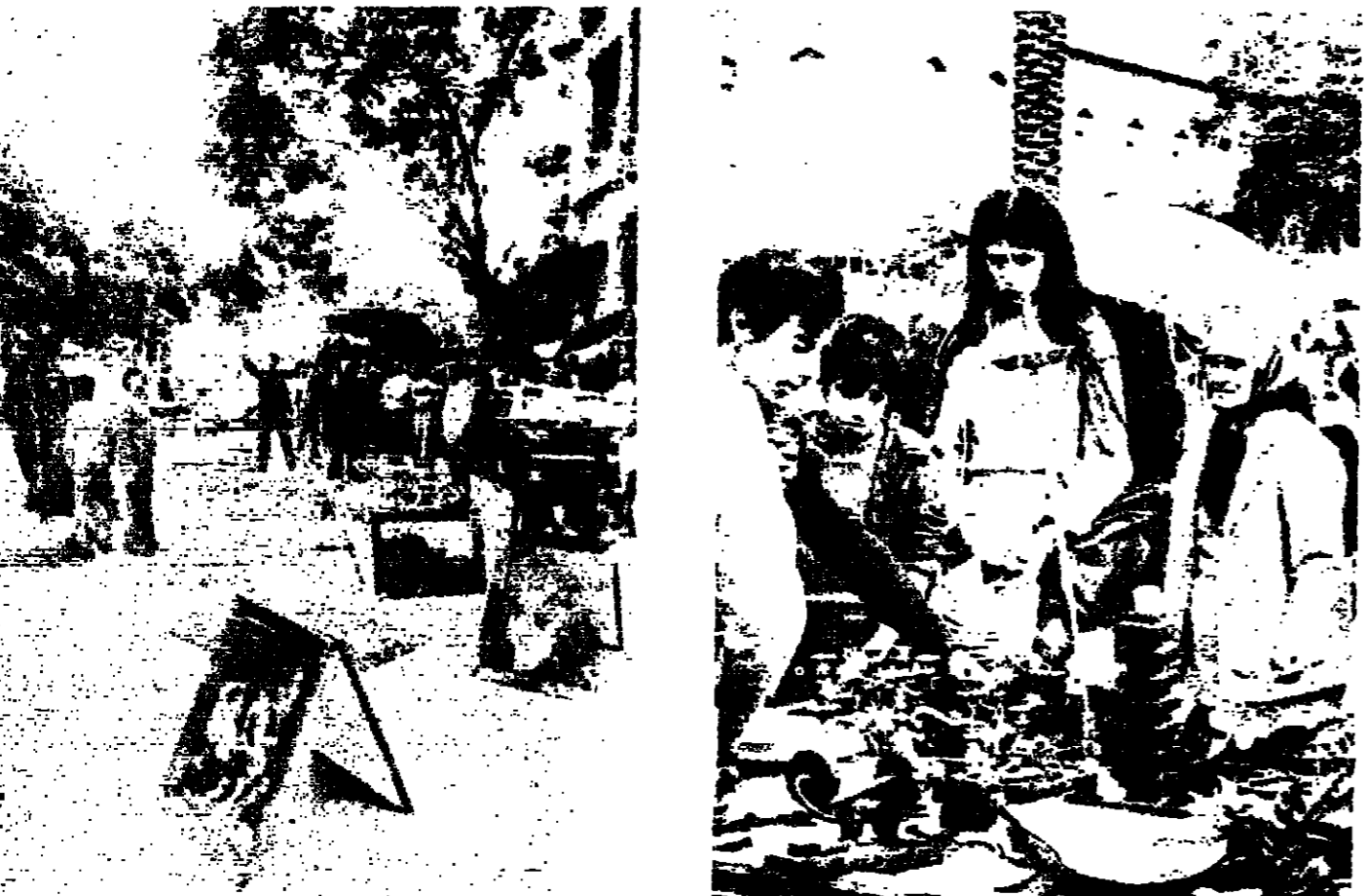
أولاد وسيدات يسطن من سمن سميري